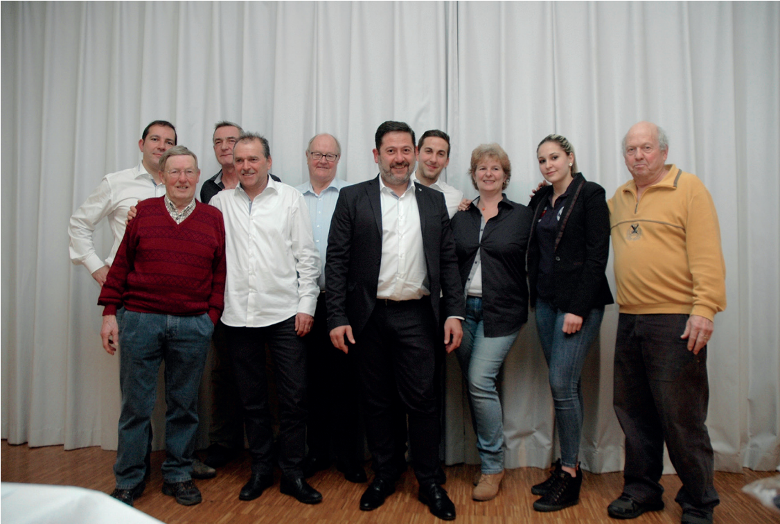
Le comité et les anciens présidents